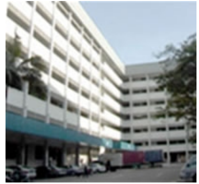
Planta da RAYCO em Singapura

Com mais de 50 plantas em todo o mundo e um total de funcionários acima de 8.000, o Grupo Seal da Parker tem se posicionado como parceiro global de seus clientes, buscando incessantemente manter os mais altos padrões de qualidade, serviços e entrega em todas as suas operações. O elevado compromisso com clientes e parceiros têm garantido crescimento anual composto acima de 16% nos últimos 10 anos e a certeza de que este compromisso é a essência do nosso negócio e a razão do nosso sucesso.