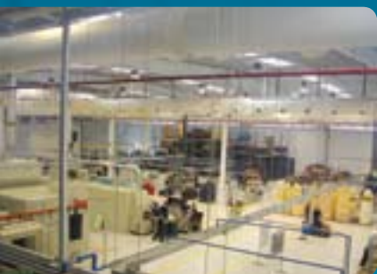
■ Área da produção de filtros