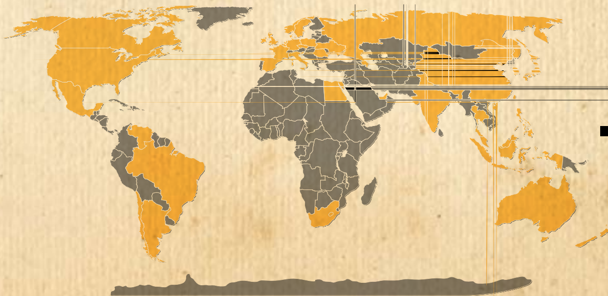
■ Em amarelo no mapa, os países onde a Parker está presente no mundo