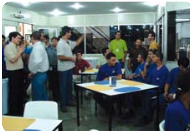
■ Colaboradores comemoram o recorde