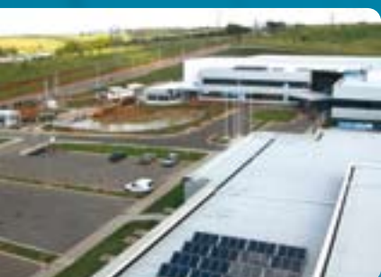
■ Vista superior

da fábrica, antes localizada em Jacareí (SP), já havia sido atingido.