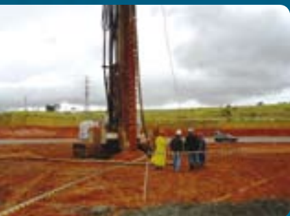
■ Primeira estaca da construção