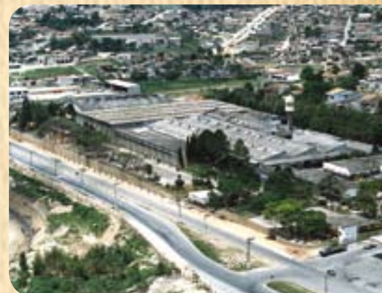
■ Planta atual da Parker, em Jacareí (SP), antiga Schrader Bellows

A empresa conta com um efetivo de mais de 1.550 colaboradores diretos atuando em seis fábricas, atualmente, duas em Jacareí (SP), uma em São José dos Campos (SP) - recém-inaugurada, duas em São Paulo (SP) e uma em Cachoeirinha (RS), além dos mais de 300 distribuidores autorizados.