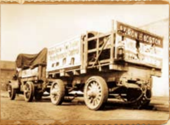
■ Caminhão que despencou na ribanceira com a mercadoria

Tudo começou quando um engenheiro de 33 anos chamado Arthur L. Parker fundou a Parker Componentes, em 1918. O Sr. Parker alugou um galpão no lado oeste da cidade de Cleveland (EUA) para desenvolver um inovador sistema pneumático para freios de caminhões e ônibus.