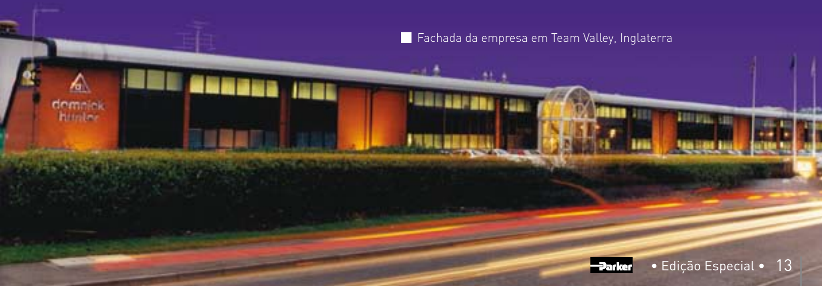
■ Fachada da empresa em Team Valley, Inglaterra

A excelência em tecnologia e exportação foi reconhecida por oito vezes com o Queen's Awards para a indústria. Em 1987, a Domnick Hunter tornou-se a primeira empresa britânica de filtros a conseguir o registro ISO 9001. O grupo tem subsidiárias e associações em 25 países, 10 plantas com mais de 60.000m 2 de área de produção, laboratórios e escritórios. Os muitos grupos de operação estão divididos em duas áreas de negócios: Operações Industriais e Operações de Processo.