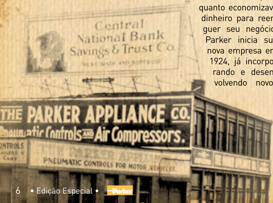
■ Primeira Sede da Parker em Cleveland (EUA)