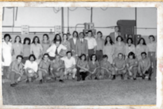
■ Equipe da primeira unidade fabril da Parker Brasil

Em 2001, a Atenas, empresa brasileira com reconhecida tradição no ramo de refrigeração é adquirida. No ano seguinte, com a aquisição da ITR, empresa italiana especializada na fabricação de mangueiras e conexões, incorpora-se a ITR Brasil Metaltubo à Divisão Fluid Connectors.